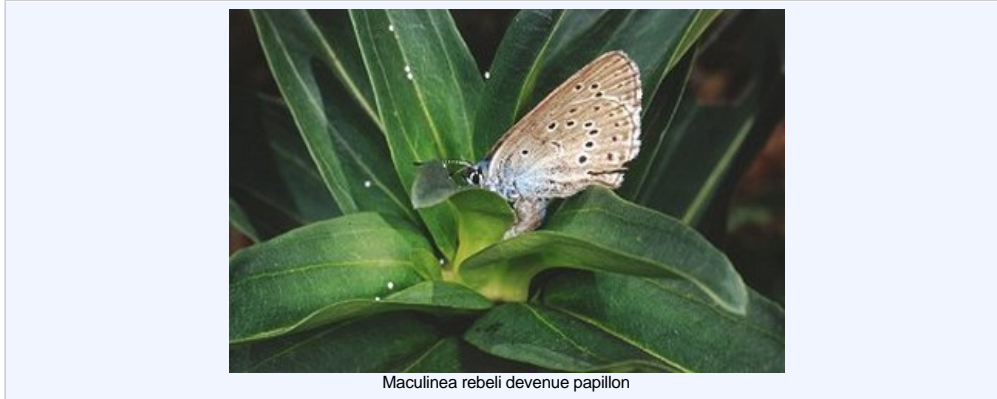
Maculinea rebeli devenue papillon

Les chenilles parasites Maculinea rebeli trompent les fourmis ouvrières pour bénéficier d'un traitement royal en mimant les sons de la fourmi reine.